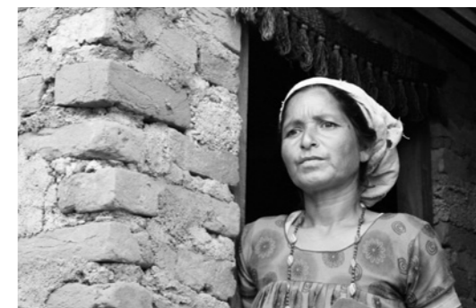
パンパたちのお母さん