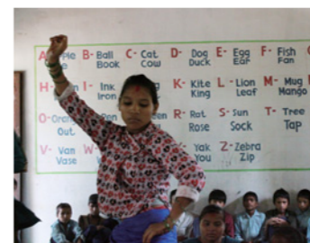
6. 「子どもクラブ」は、子どもたちが自分の感情や意思を表現できる場。