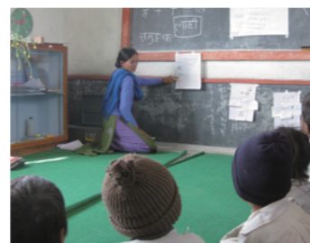
15. 私たちの教育支援は他にもあります。子どもの視線を考えた壁一面の黒板と真新しいカーペット。学習環境を整えます。