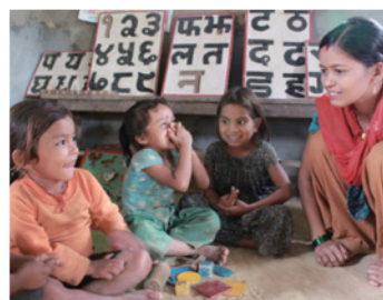
18. 小学校にすぐになじめるように幼児教育にも力を入れています。優しい先生、たくさんの遊具。楽しそうな雰囲気、伝わってきませんか？