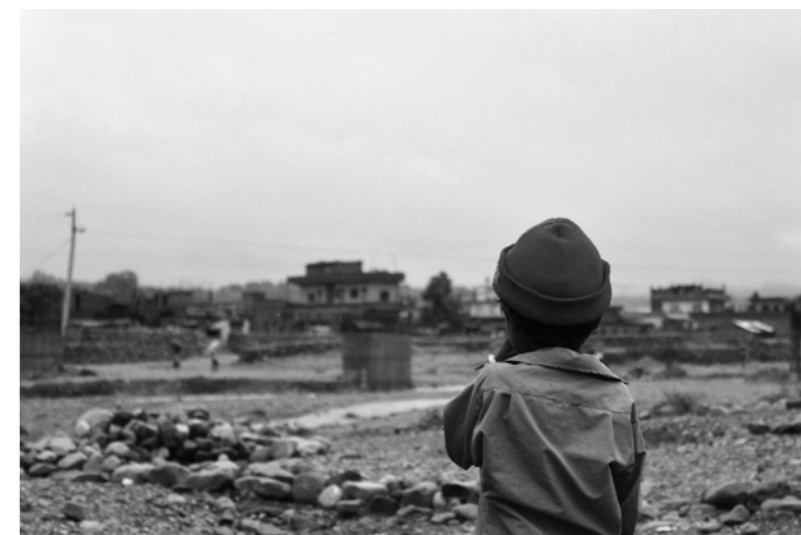
パンパ(5歳)と家の前に広がる景色

1年前のある日。家に 村の子どもや大人たちがやって来た。 奨学金の制度があるから、 パンパたちを学校に通わせてほしいと、 説得されたお母さん。