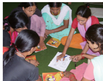
10. 教員育成も計画の一つ。生徒を差別しない、体罰を行わない教員を育てることは、紛争や、カースト、民族の問題を抱えるネパールでは必要不可欠です。