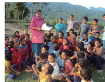
5. 入学キャンペーンに毎年参加する「子どもクラブ」のメンバーたち。学年や民族を問わず集まって、社会的な活動を自主的に行います。