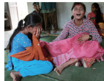
7. 早婚や、差別、児童労働、家庭内暴力といった社会問題を、路上劇をとおして大人や同年代の子どもたちに訴えたりもします。