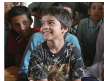
8. 「子どもクラブ」では、一人ひとりが子どもの権利を知っています。「ぼくたちは自由なんだって。自分の意思で勉強をしたり遊んだり出来るって知っているよ」