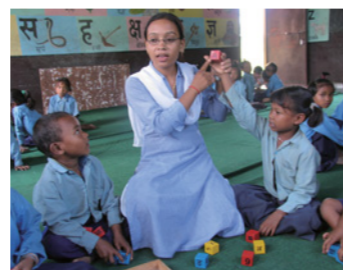
12. 「どうやったら子どもが授業に興味をもってくれるだろう？」子どもたちが学校に通いたいと思うように工夫することも、教員の役割。