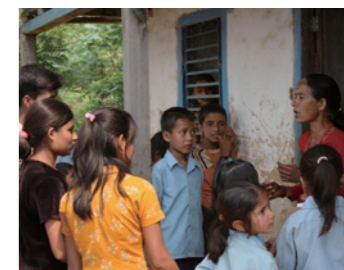
3. 「お金がないから学校にはやれないわ」と話す母親に、国の奨学金が受けられることを説明。

— 今後は、ネパール西部平野での支援現場の様子をお伝えします — すべての子どもが学校に通えるように、みんなが出来ること