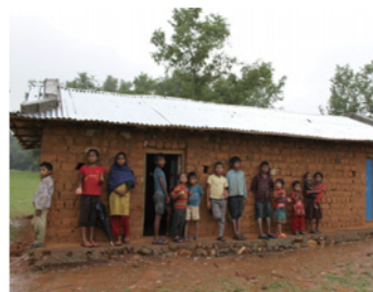
16. 小学校が遠かったり、編入の準備が必要な子どもたちには、分校を運営したり、識字教室を開いています。