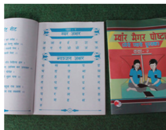
17. ネパール語でなくタルー語を母語とする先住民族のための教材。タルー語の教員研修をし、教材を配布した結果、子どもの学習到達度もアップ。