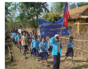
2. 兄妹が学校に通うきっかけとなった入学キャンペーンの様子。子どもも大人もNGOも、みんなで村中をまわって学校に通っていない子どもを探し出します。