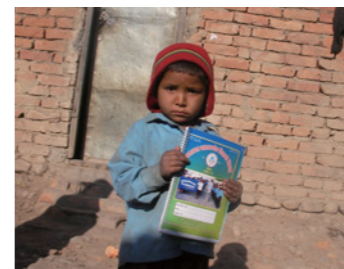
4. パンパのように奨学金だけでは十分でない子どもには、SCJから制服や学用品など奨学品を配給します。