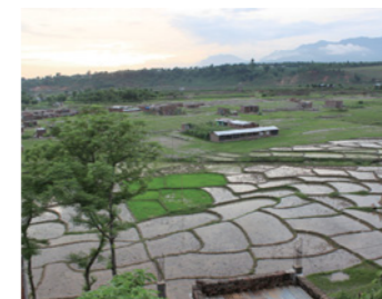
1. パンパたち親子が暮らす、ネパール西部のダン郡、そしてスルケット郡が私たちSCJの活動地。