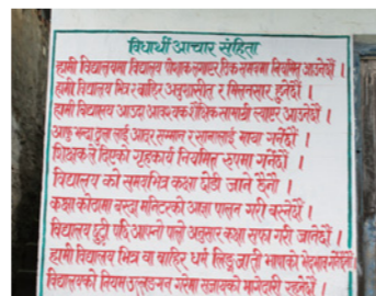
11. 「差別をしない」「体罰をしない」ことは、教員、保護者、子どもたちの約束事として学校の壁にも掲げられています。