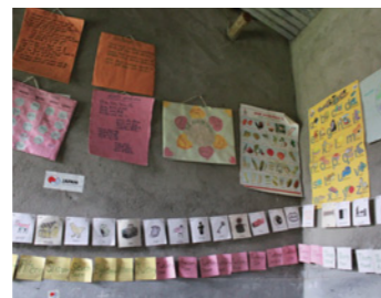
13. 壁に並んだ素敵な教材。すべて教員たちの手作りです。