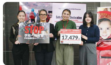
ユースと対談したインゲル・アッシン