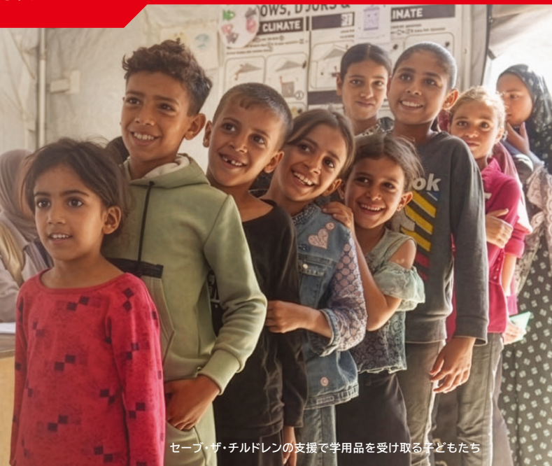
セーブ・ザ・チルドレンの支援で学用品を受け取る子どもたち

封鎖以降、ガザ地区はたびたび空爆され、多くの市民が犠牲になってきましたが、2023年10月7日以降の攻撃では未曾有の被害が出ており、これまでに7万人以上(うち子ども2万人以上)の市民が犠牲になりました。