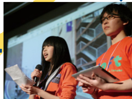
2013年5月 第4回 “夢のまちプラン”を実現してきた活動を発表