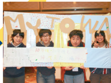
2012年12月 第3回 東北内外の子ども同士で話し合い