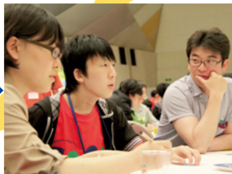
2012年5月 第2回 子どもとおとなが一緒に話し合い