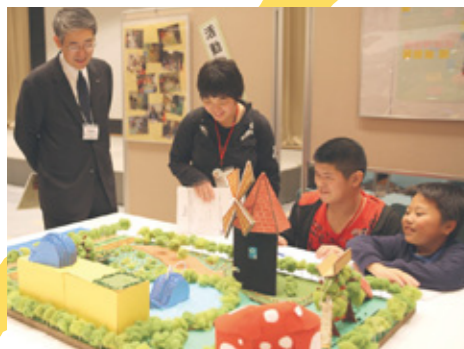
2011年11月 第1回 “夢のまちプラン”を発表!