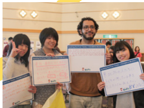
2014年5月 第5回 復興に向けて、子どもおとなも声を発信!